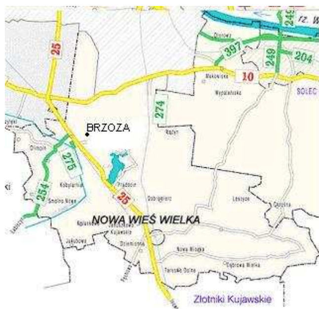
Map.1. Lokalizacja miejscowości Brzoza