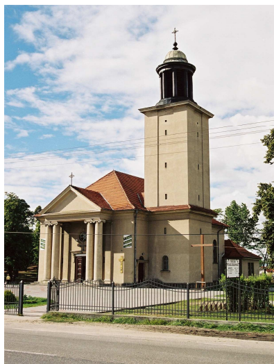
Fot. Kościół p.w. NMP Królowej Polski w Brzozie

Ponadto na uwagę zasługuje zespół kościelny w Brzozie, składający się z kościoła parafialnego p.w. NMP Królowej Polski (1934-1939) oraz plebani, zbudowanej w stylu dworkowym w 1938 r. Cały kompleks został objęty ochroną konserwatorską poprzez ujęcie w ewidencji zabytków.