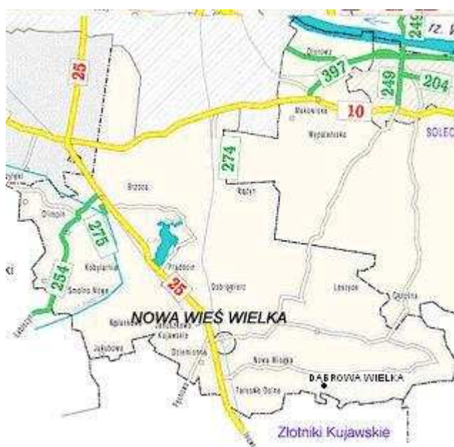
Map.1. Lokalizacja miejscowości Dąbrowa Wielka

Miejscowość Dąbrowa Wielka położona jest w środkowej części województwa Kujawsko-Pomorskiego, w obrębie powiatu Bydgoskiego, w południowo-wschodniej części gminy Nowa Wieś Wielka. Dąbrowa Wielka położona jest ok. 27 km na południe od Bydgoszczy.