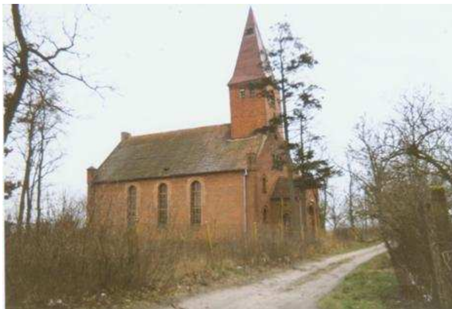
Fot. Widok na kościół w Dąbrowie Wielkiej