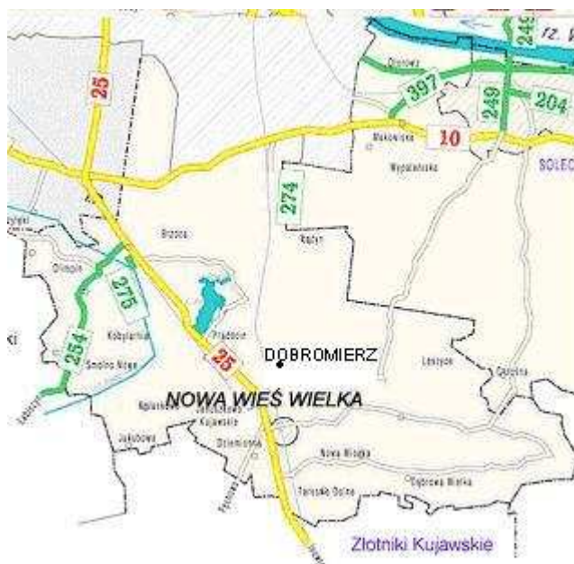
Map. 1. Lokalizacja miejscowości Dobromierz

Miejscowość Dobromierz położona jest w środkowej części województwa Kujawsko-Pomorskiego, w obrębie powiatu Bydgoskiego, w gminie Nowa Wieś Wielka (na północny-wschód od miejscowości Nowa Wieś Wielka), w fizyczno-geograficznym mezoregionie zwanym Kotliną Toruńsko-Bydgoską.