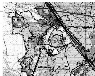
TEREN OBJĘTY MIEJSCOWYM PLANEM ZAGOSPODAROWANIA PRZESTRZENNEGO

STAROSTWO POWIATOWE W BYDGOSZCZY Powiatowy Ośrodek Dokumentacji Geodezyjnej i Kartograficznej W obszarze oznaczonym linkami ..... potwierdzono w terenie aktualność treści mapy zasadniczej, dokumenty potwierdzające aktualność mapy przyjęto do zasobu w dniu 8.01.2013 r. i zweryfikowano pod nr 16/2013. Niniejsza mapa może służyć do celów projektowych. Projektowane obiekty budowlane wymagające pozwolenia na budowę podlegają wytyczeniu i inwentaryzacji powykonawczej przez jednostki uprawnione do wykonywania prac geodezyjnych. Z up. Starosty Bydgoskiego Bydgoszcz, dn. 8.01.2013 r.